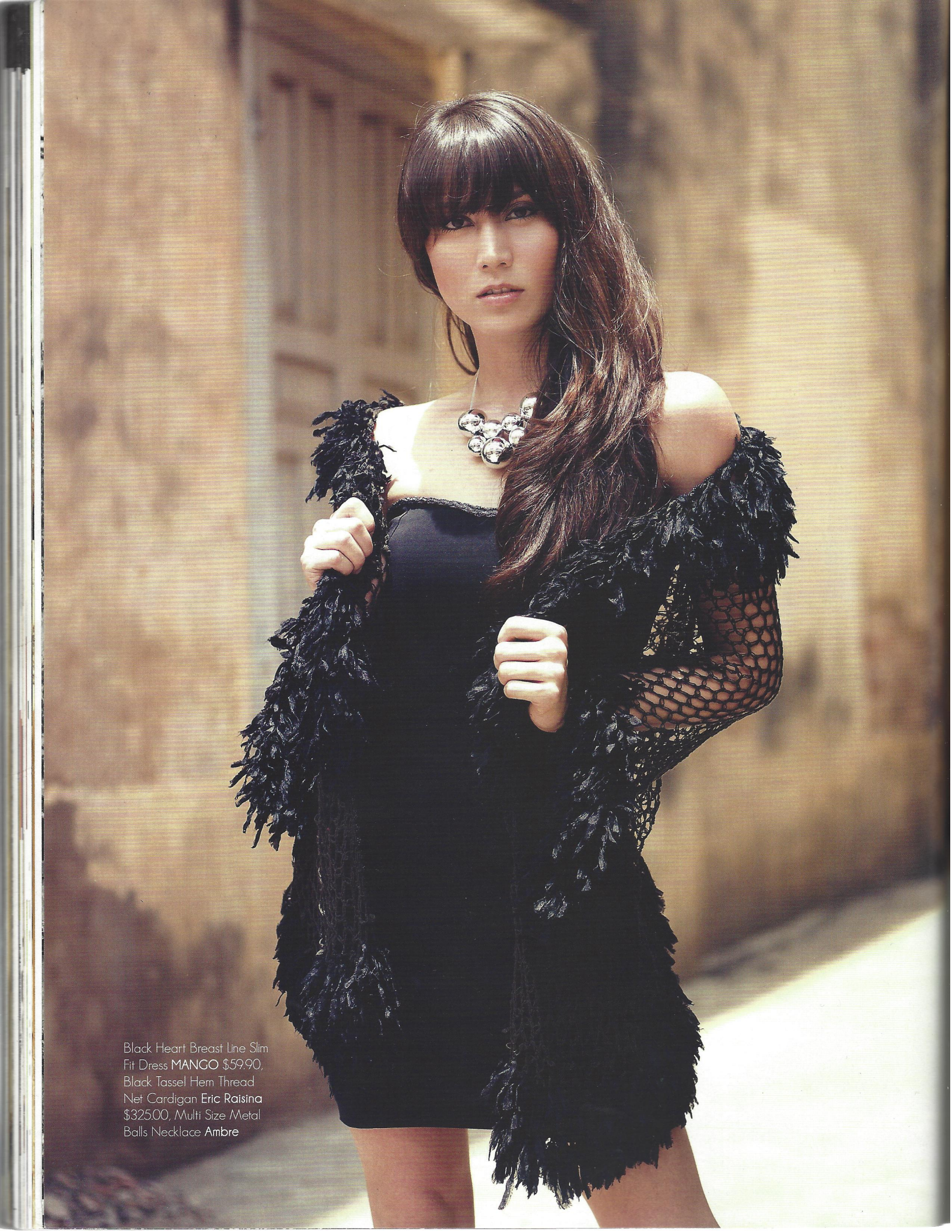
Black Heart Breast Line Slim Fit Dress MANGO $59.90, Black Tassel Hem Thread Net Cardigan Eric Raisina $325.00, Multi Size Metal Balls Necklace Ambre